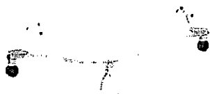
Huśtawka wagowa metalowa podwójna